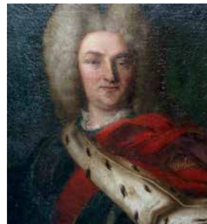
Un représentant de l'État royal ?