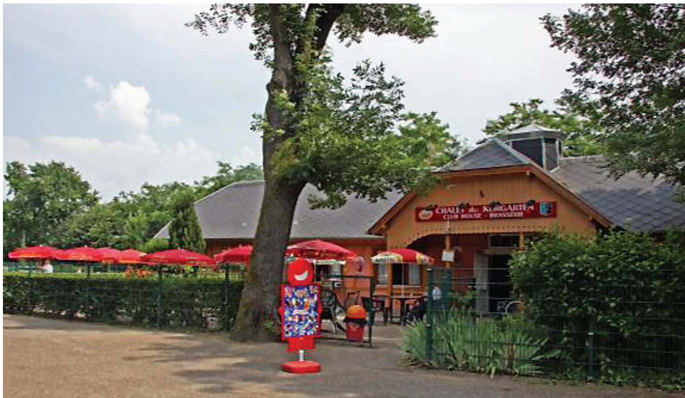
Repas des Anciens Elèves en mars 2020 au chalet du Kurgarten

- Diffusion (annuellement) de la Gazette de l'association (en début d'année) et newsletter en juillet